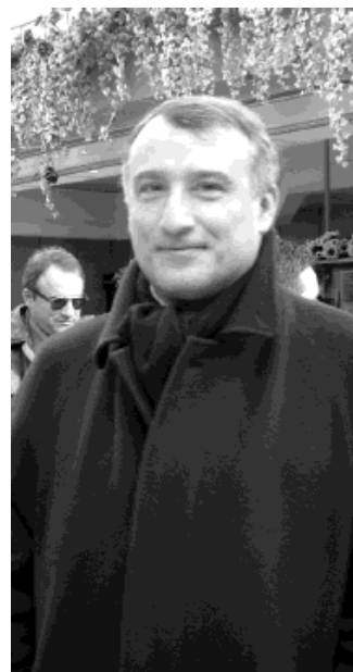
Il presidente Piero Marrazzo

Le vengo a chiedere: 1) E' stato realizzato uno studio sui flussi di au-