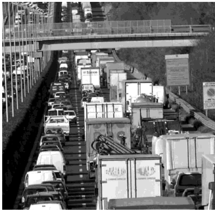
Situazione difficile ogni giorno per i pendolari

«Signor Presidente, quale rappresentante dell'associazione Pendolari della Valle dell'Aniene, vengo ancora a segnalare