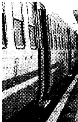
Un treno regionale

VELLETRI - Domani mattina l'inverno antismog di Legambiente si apre con "Pendolaria", la nuova campagna nazionale per dare voce e sostegno a tutti gli italiani pendolari che rivendicano il diritto a una mobilità efficiente, sicura e pulita. Coloro che, con la scelta del treno, contribuiscono a ridurre gli ingorghi automobilistici che soffocano quotidianamente le nostre città.