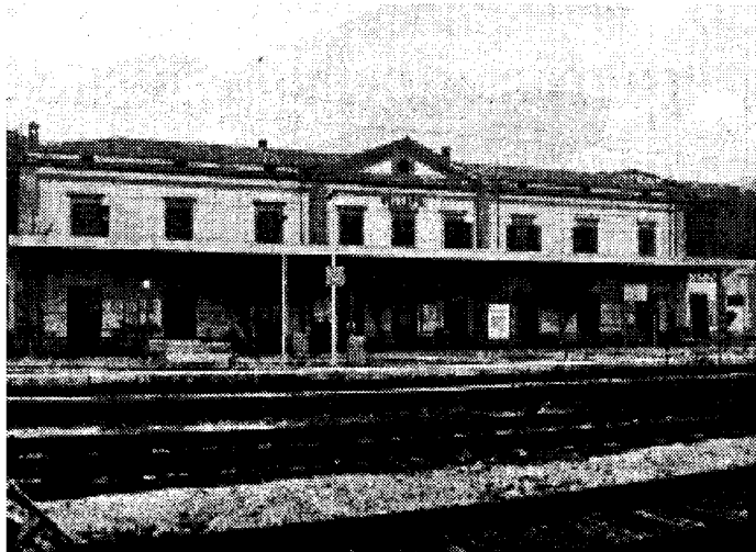
La stazione ferroviaria di Velletri